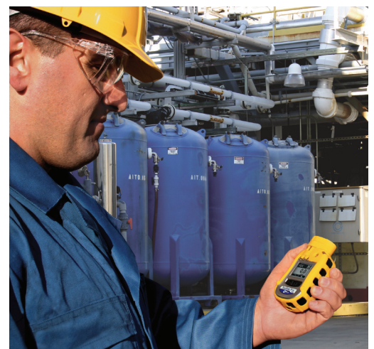
Control de la exposición de los trabajadores con ToxiRAE Pro PID en una planta de PVC